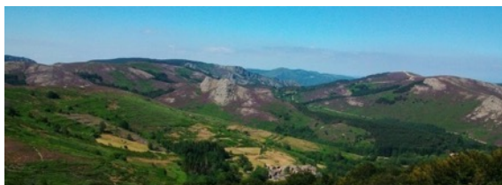
Base du stage : hameau de Douch au cœur du massif